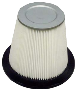
Grand filtre cartouche